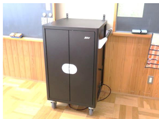
じゅうでんほかんこ 充電保管庫