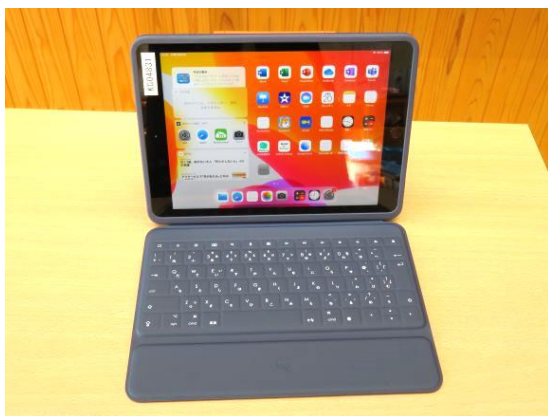
はいち 配置された iPad